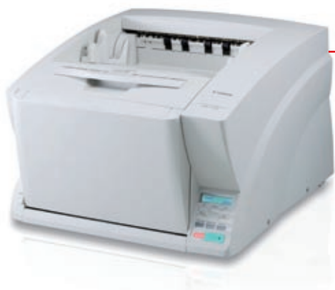
Stroj DR-X10C je schopen zpracovat širokou škálu velikostí dokumentů v jediné dávce

Inovativní funkce společnosti Canon – detekce sešití – ihned zastaví podávání dokumentu, jakmile stroj rozpozná sešivací sponku. Dokument i zařízení jsou tak chráněny před poškozením.